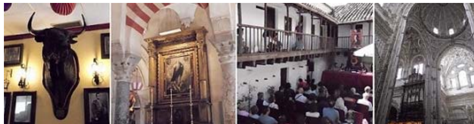
Imágenes de los lugares de Córdoba donde se presenció Cosmopoética.

No faltaron los eventos como a la antigua usanza. La Posada del Potro, lugar emblemático del centro que ya restaurado alberga en sus aposentos a la retórica y a veces al teatro, fue el lugar idóneo para que en las mañanas vieran la luz poemas venidos de muy lejos. La poesía internacional de Fatema al-Gurra (Palestina) nos envolvió con el manto de la sensualidad y tras pedir un minuto de silencio por los conflictos en el mundo árabe, nos comentó que todo lo que está escribiendo actualmente está dedicado e inspirado por la sangre derramada y la fortaleza de aquellos pueblos que están luchando por la libertad y por los derechos humanos en los países árabes. Otros poetas, como Valter Ugo (Angola) nos hicieron reír con sus versos irónicos, llenos de humor y de comicidad, con la lectura de poemas como por ejemplo "El hueso de la Polla", o "La maquina de hacer españoles". Tampoco faltaron poetas nacionales, como Blanca Andreu (Galicia) que nos acercó a las islas griegas al leer textos de su último libro titulado "Los archivos griegos", ni la fatalidad de los argentinos, como Fabián Casas, que confesó que a pesar de ser "un depresivo demoledor" estaba sintiendo tanta felicidad y dicha en Córdoba que quizás, tras esta experiencia, no tuviera más remedio que dejar la escritura.